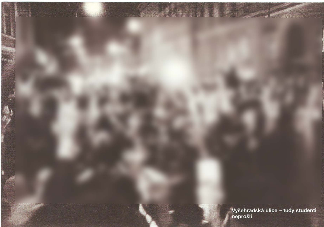
Vyšehradská ulice – tudy studenti neprošli

duše „nepřátelské, chuligánské nebo deklasované živly“. Přitom v průběhu šedesátých let se stali protivníky příslušníků pořádkových jednotek výhradně mladí lidé, většinou studenti, kteří byli mezi lety 1962 a 1967 čas od času mláceni tu na Petříně, jindy po skončení majáles.